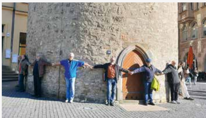
Wie viele Geodäten benötigt man für die Vermessung des Leipziger Turms in Halle. Erprobung der neuen Maßeinheit „Geodäten“. S. 91

Redaktionsschluss für redaktionelle Beiträge für die Ausgabe 2/2023: 15. Februar 2023