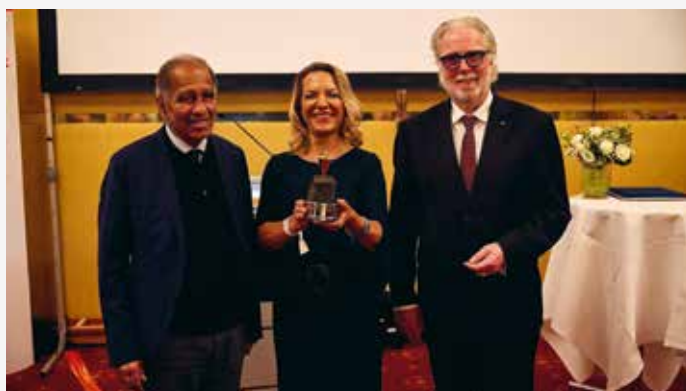
Prof. Dr. Antje Boetius erhielt in KÖLN das GOLDENE LOT 2022 S. 75