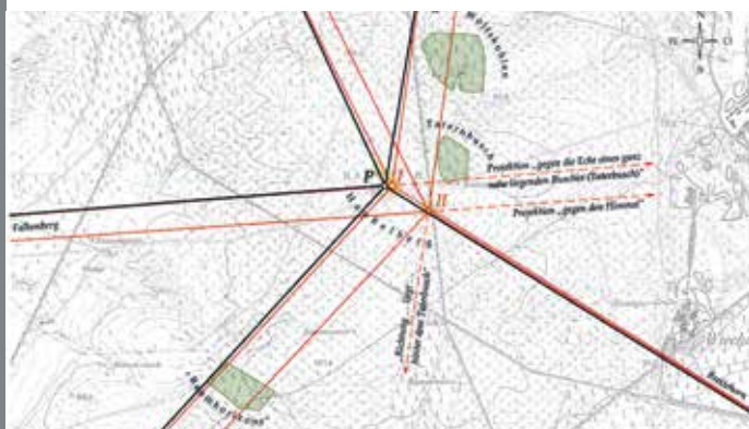
Die Auflösung der Haußelberg-Problematik S. 14