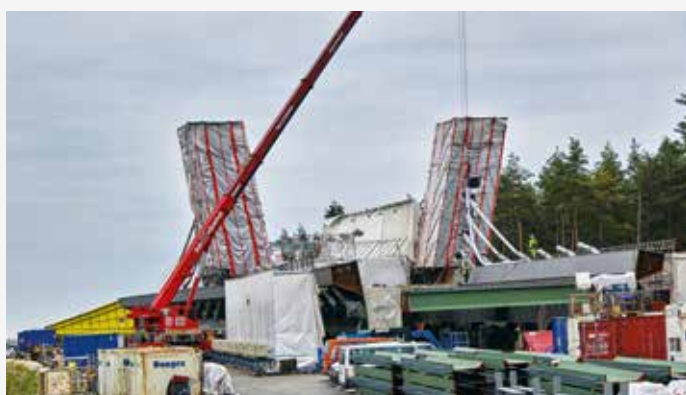
Baustellenbesichtigung: Stahlverbundbrücke am AK Nürnberg Ost im Takt-schiebeverfahren – Länge 588 m – Stahl 8.500 t – Kosten 65 Mio. Euro S. 80