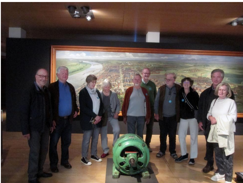
Bild 2 Gruppenbild vor dem Bayer-Panorama

Das unglaublich detaillierte Bild der Fabrikanlagen der Bayer-Werke aus der Zeit um 1920 diente uns als passender Hintergrund für das Gruppenfoto.