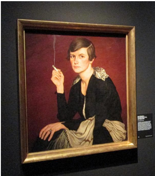
Bild 3 Emanzipierte Frauen waren plötzlich präsent

Neben der umfangreichen Bildersammlung gab es auch einige Technik zu besichtigen. Eine interessante und vielseitige Ausstellung, die uns durch die lockere und detaillierte Führung einer Mitarbeiterin des Museums einen guten Überblick über die damalige Zeit gab.