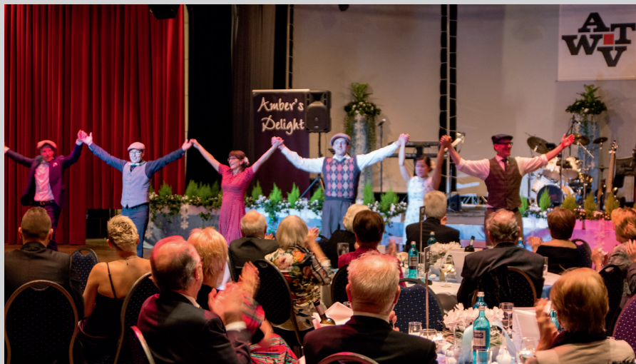
Großen Beifall bekam die Showtanzgruppe „Lollipop“ aus Nettetal

für Gespräche zur Auffrischung alter und Anknüpfung neuer Kontakte ließ. Schade ist jedoch, dass in diesem Jahr nur 160 Gäste den Weg zum Fest der Technik fanden.