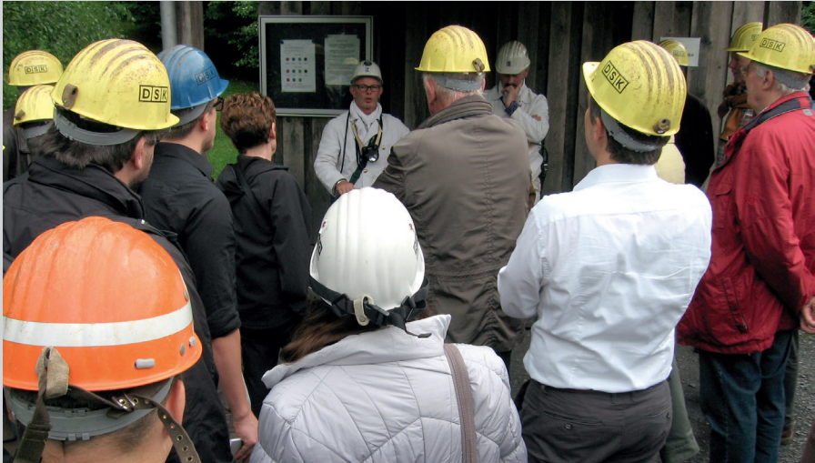
Vorbereitung zur Führung durch das Museum der Zeche Nachtigall

Die Begegnung mit dem Deutschen Markscheider-Verein führte uns am 02.06.2016 zum Industriemuseum Zeche Nachtigall. Nach interessanten Vorträgen zum Thema Grubenwasserkonzept in der Nachbergbauzeit erwartete die Teilnehmer eine ebenso interessante Führung durch das Museum Zeche Nachtigall.