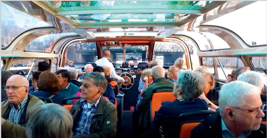
Bootstour entlang der Grachten

Auf einer anschließenden Bootstour entlang der Grachten konnten wir die Landschaft mit den Brücken und den historischen Häusern genießen.