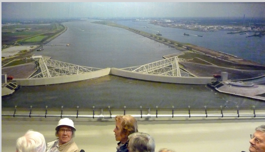
Vortrag während des Besuchs des Maeslant-Sperrwerks