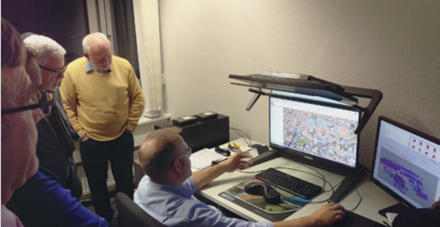
Erläuterungen zu den Aufgaben der Aerowest GmbH

Im März 2019 wird sich der Bund Deutscher Baumeister, Architekten und Ingenieure (BDB) im Rahmen der ATWV-Begegnung mit einem Vortrag und anschließender Besichtigung des erst kürzlich eröffneten Baukunstarchivs NRW präsentieren. Näheres auf Seite 7.