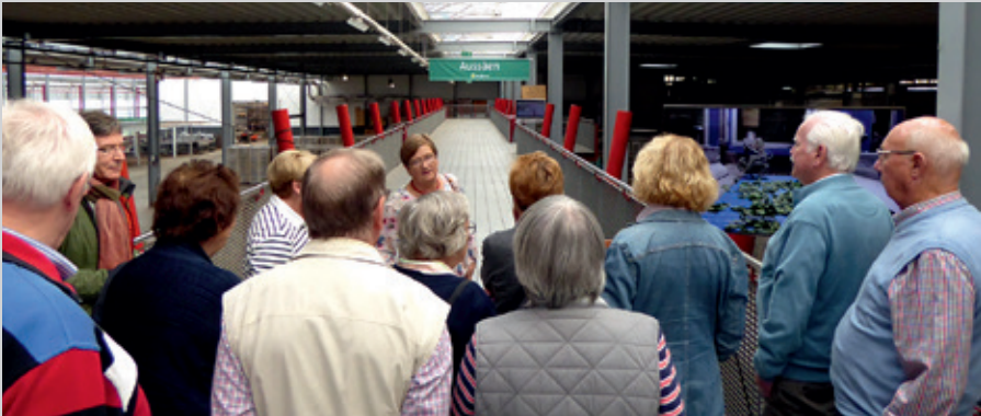
Erlebnispark Emsflower: Führung durch den Produktionsbereich

Ein Höhepunkt war die ATWV-On-Tour vom 15. bis 17. September ins Emsland. Die Fahrt mit dem Reisebus führte uns zuerst in den Erlebnispark Emsflower in Emsbüren. Auf rund 24.000 qm präsentiert sich eine Garten- und Erlebniswelt mit einem breit gefächerten Angebot. In Begleitung fachkundiger Mitarbeiterinnen wurden wir durch den Produktionsbereich geführt. Bei diesem Rundgang wurde uns die Technik und die Logistik erklärt. Zu den schönsten Plätzen der Anlage gehören der Tropengarten, die Schmetterlingsattraktion und das Schaugewächshaus. Nach Beendigung der Führung konnten die Teilnehmer im Wintergarten mit mediterranem Flair zwischen allerlei Köstlichkeiten wählen und sich für die Weiterfahrt stärken. In Emden angekommen fuhren wir direkt zum alten Binnenhafen, der in der Stadtmitte Emdens liegt. Der maritime Standort bietet eine Aussicht auf den Alten Ratsdelft mit seinen Museumsschiffen, dem Seenotrettungskreuzer und Museumsfeuerschiff. Im 16. Jahrhundert war Emden der wichtigste Umschlagplatz an der Nordsee. Auf einer Bootsfahrt mit dem Hafenboot „Ratsdelft“ konnten wir die verschiedenen Sehenswürdigkeiten an uns vorbeiziehen lassen.