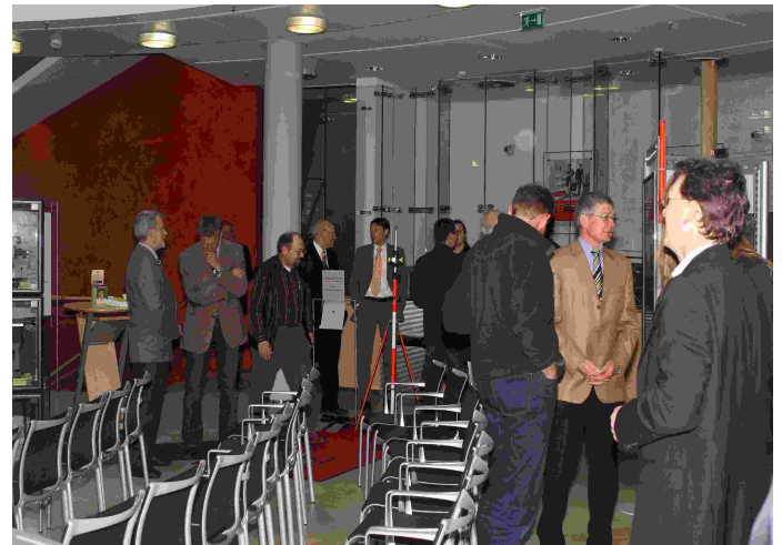
Die Gäste treffen ein