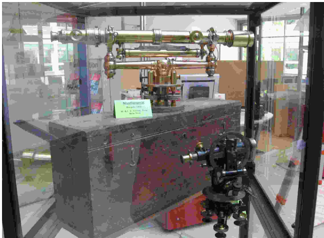
altes Instrumentarium in der Ausstellung