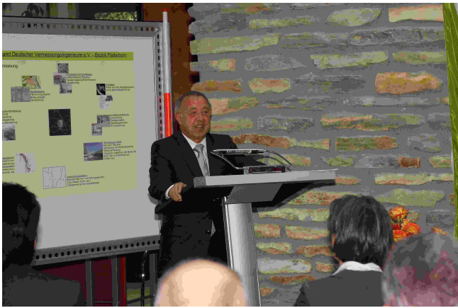
Gerhard Wächter, MdB (CDU)