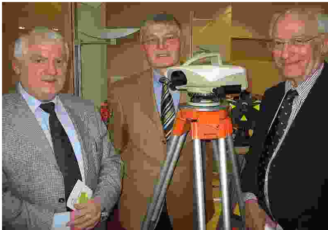
Die drei anwesenden Gründungsmitglieder