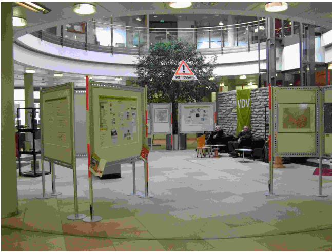
Die Ausstellung vom Sparkasseneingang aus