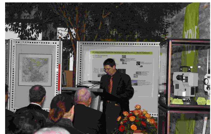
Begrüßung durch den 1. Vorsitzenden