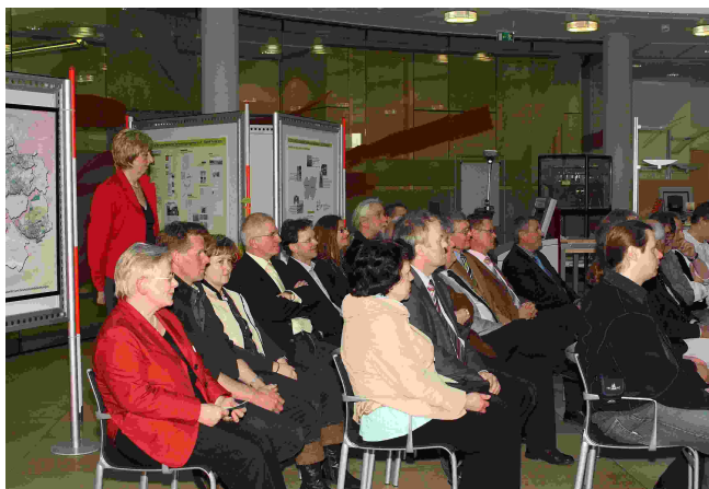
Ein Teil des Auditoriums