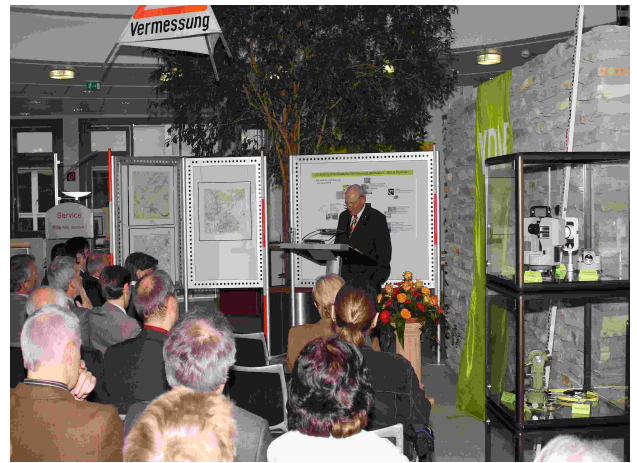
Impression während des Festvortrags