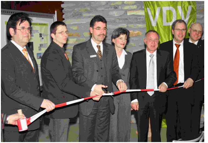
Die Ausstellung wird eröffnet...