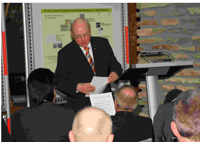
Die Weseler Resolution wird verteilt