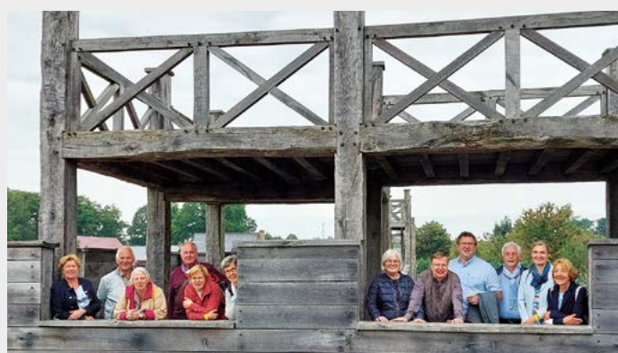
Der VDV Bezirk Dortmund bei den Römern in Haltern