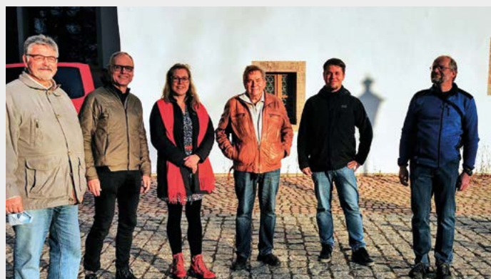
Das Schloßbergmuseum wurde von dem Bezirk Süd-West-Sachsen unter fachkundiger Leitung erkundet