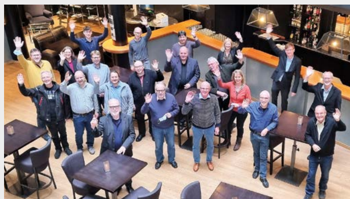
Gruß von der Bundesvorstandssitzung in Hannover