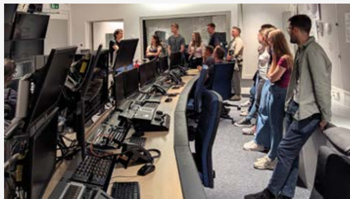
Die Studierenden der HS Mainz übernehmen die Regie beim ZDF S. 309

Redaktionsschluss für redaktionelle Beiträge für die Ausgabe 5/2026: 24. Juli 2026