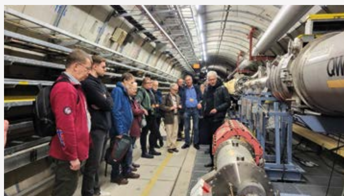
Die Hamburger im Beschleunigertunnel von DESY S. 302