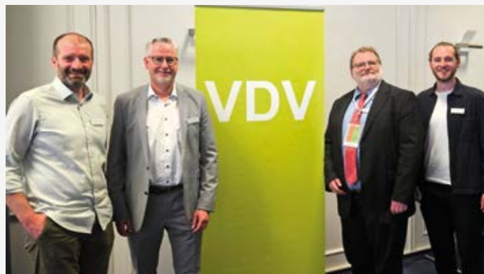
Neues Präsidium in Göttingen gewählt S. 293