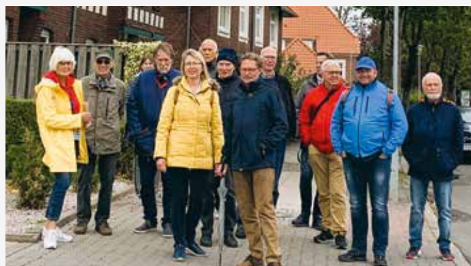
Der Landesverband Hamburg/Schleswig-Holstein auf Exkursion: Hier im Beamtenviertel von Brunsbüttel S. 553