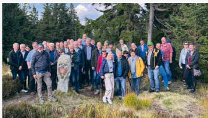
Die Teilnehmer des 16. Landesverbandstages beim historischen Dreiherrenstein an der Grenze Sachsen – Tschechien S. 562

Redaktionsschluss für redaktionelle Beiträge für die Ausgabe 1/2023: 15. Dezember 2022