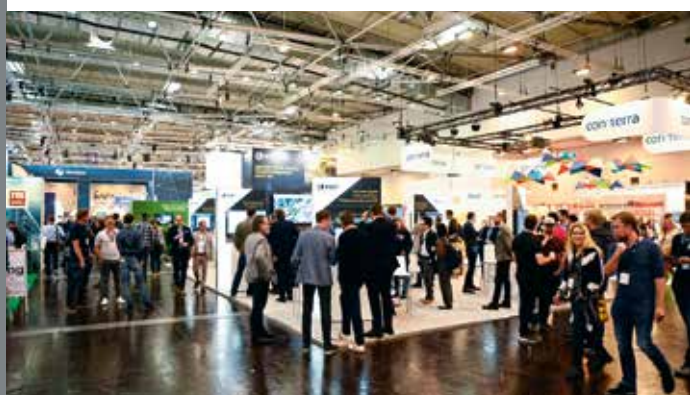
INTERGEO 2022 VDV Messerundgang – Teil 1