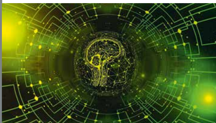
KI in der Geodäsie