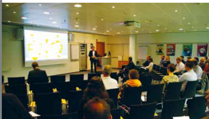
BILDUNGSWERK VDV Seminar Geo-Info-Dok 7.1