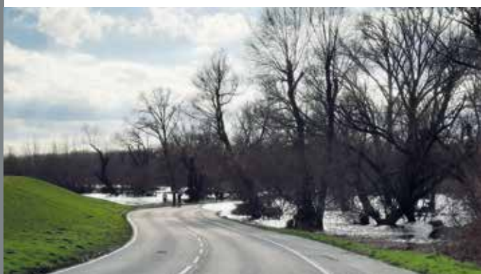
Umsetzung der Wasserrahmenrichtlinie