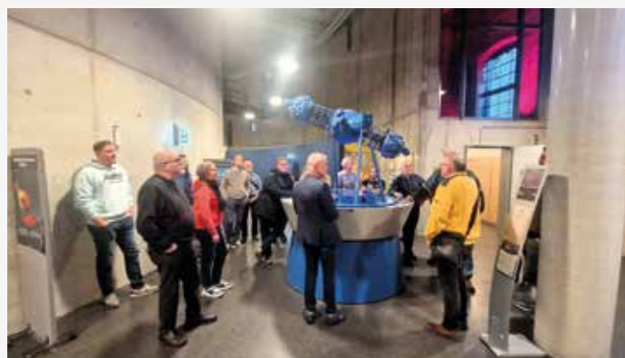
Der VDV-Bezirk Halle besuchte das neue Planetarium in Halle S. 184

Redaktionsschluss für redaktionelle Beiträge für die Ausgabe 3/2024: 20. April 2024