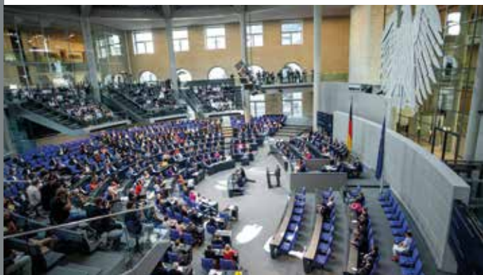
Aus der Politik