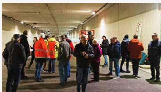
Besuch des neuen Bremerhavener Hafentunnels des LV Bremen/Unterweser S. 172