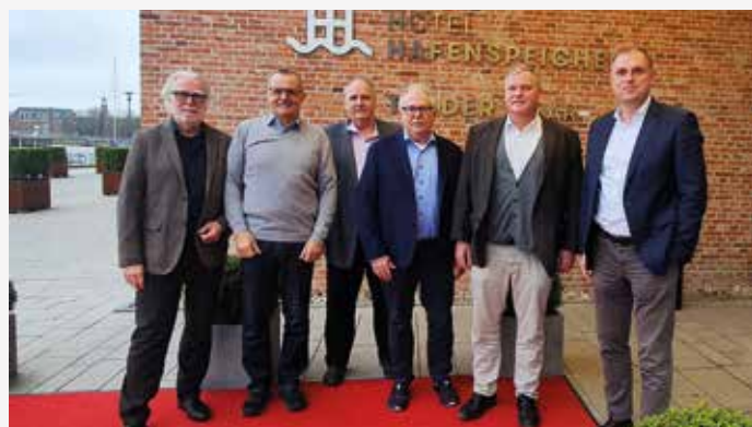
Die InteressenGemeinschaft Geodäsie (IGG) traf sich in Leer S. 166