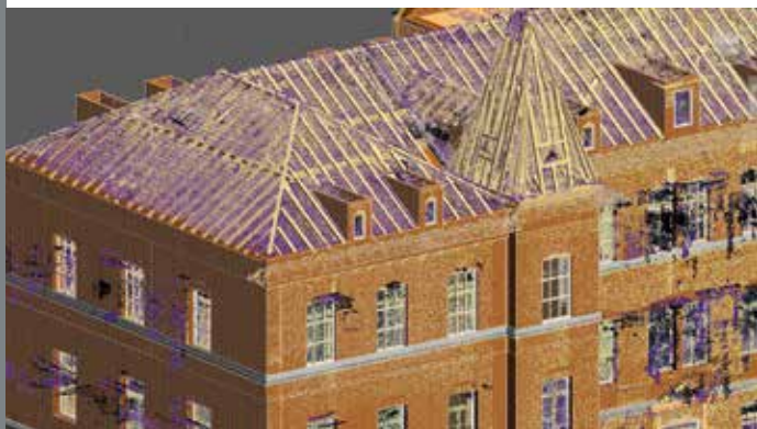
3D-Modelle für Geodäten