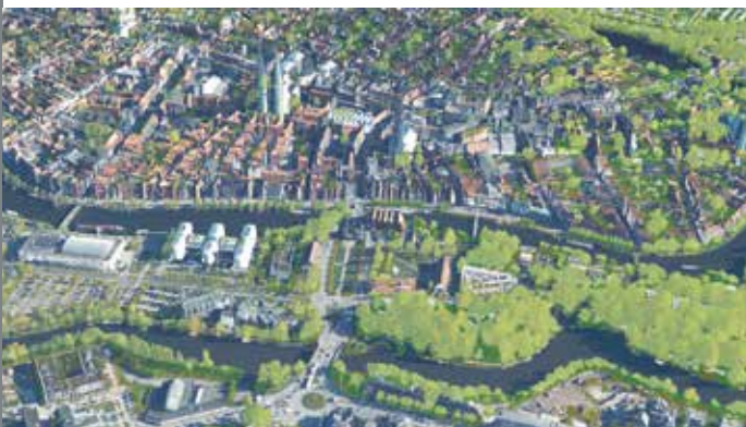
Lübeck in einer eingefärbten 3D-Punktwolke – Vegetationsanalyse