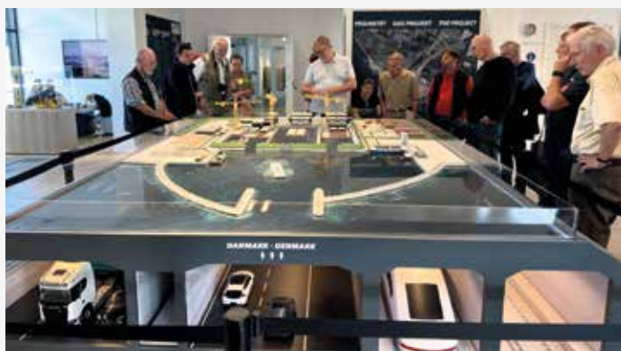
HH/SH besichtigte die Baustelle des Fehmarnbelt-Tunnel