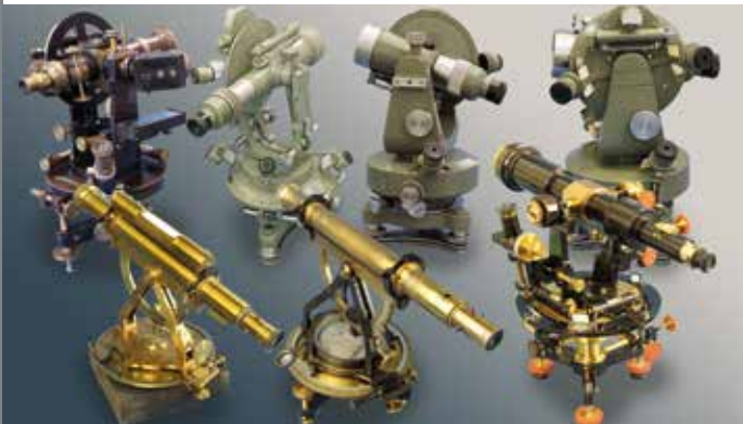
Die Entwicklung des geodätischen Instrumentenbaus in Tschechien