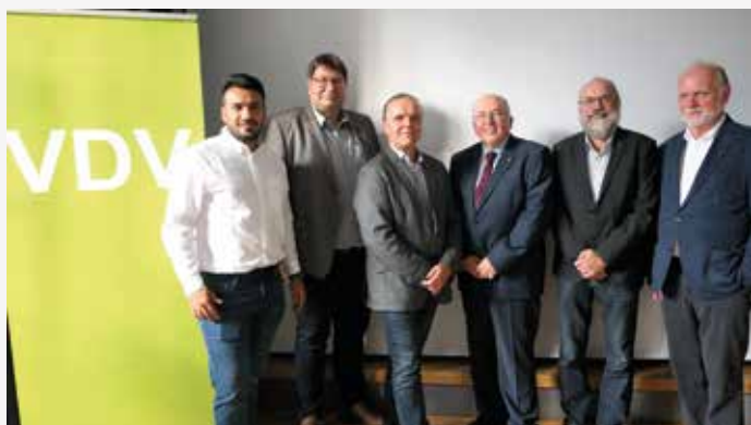
Der neu gewählte Landesvorstand des Landesverbandes Sachsen-Anhalt