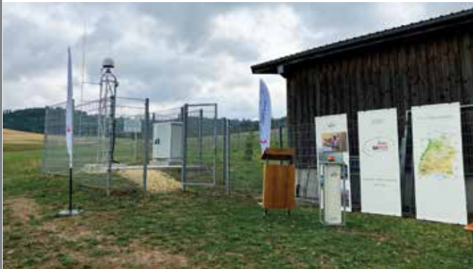
SAPOS-Station Waldstetten am Tag der Einweihung