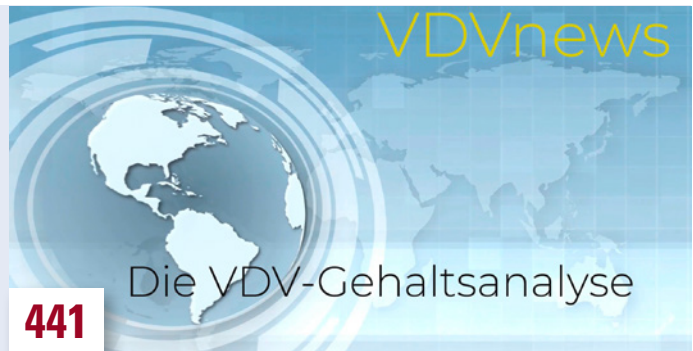
Titelbild zu einem VDV-Video zur INTERGEO