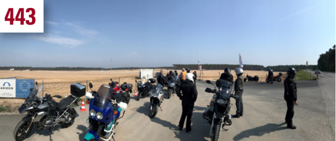
Die GEObiker auf Tour durch den Oderbruch und die sächs. Schweiz