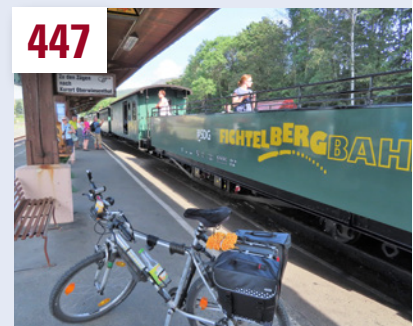
Nostalgische Anfahrt unter Dampf – Radtour vom Fichtelberg nach Dresden