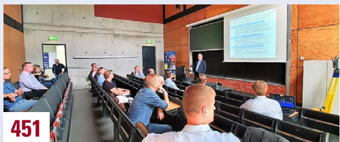
Fachveranstaltung netzwerk GIS Sachsen-Anhalt e.V.: Terrestrisches Laserscanning und BIM

Redaktionsschluss für redaktionelle Beiträge für die Ausgabe 6/2020: 20. Oktober 2020