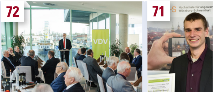
Ehrengäste und viele Gründungsmitglieder konnte der Vorsitzende zum Jubiläum 50 Jahre Landesverband Bremen/Unterweser begrüßen.

Veranstaltungskalender GEODÄSIE-AKADEMIE 95