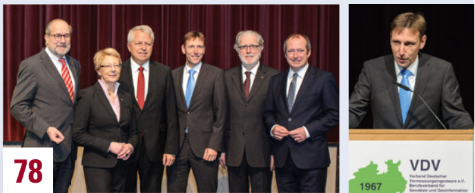
Zum Festakt 50 Jahre VDV-Landesverband NRW in Soest gab es ein Stelldichein prominenter Gäste. Den Festvortrag hielt Oliver Witte MdB, der VDV-Landesvorsitzende grüßte mit einer engagierten Rede.